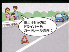
車よりも後方にドライバーもガードレールの外に ガードレールの外側など安全な場所に避難