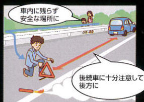
車内に残らず安全な場所に 発炎筒、三角停止表示板等を後方に設置