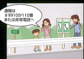
通報は#9910か110番または非常電話へ 発生した故障・事故状況を通報