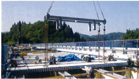
プレストレストコンクリート床版架設

損傷した鉄筋コンクリート床版を、より耐久性の高い床版に取り替えます。 (プレストレストコンクリート床版)