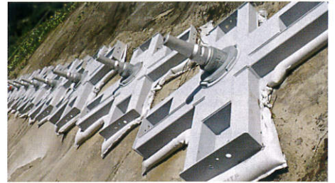
グラウンドアンカー

のり面の安定性を高めるグラウンドアンカーについて、追加のアンカーを設置することで、安定性を向上させます。